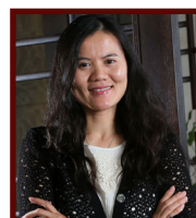
彭蕾 阿里巴巴联合创始人、 蚂蚁金服董事长