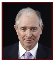
Stephen Schwarzman 黑石集团联合创始人