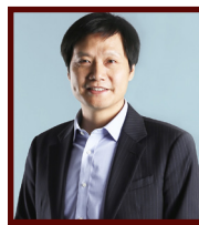
雷军 董事长兼CEO 小米科技