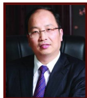
易会满 中国工商银行董 事长