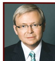
陆克文 前澳大利亚总理