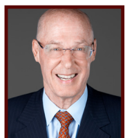
亨利·保尔森 美国前财政部长