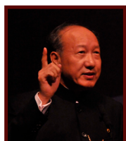
陈峰 海航集团主席