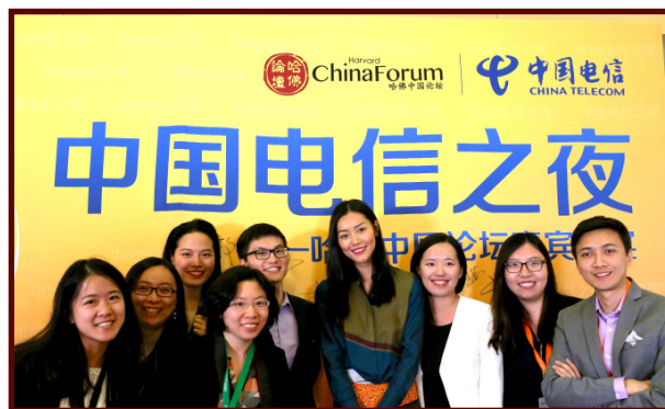
2016年赞助方中国电信代表与嘉宾超模刘雯

彭博周刊 中央电视台 CNN 东方卫视 凤凰卫视 金融时报 福布斯 腾讯网 华盛顿邮报 华尔街日报 新华社 新浪 中国日报