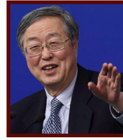
周小川 中国人民银行行长、 党委书记