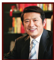
陈东升 泰康人寿董事长