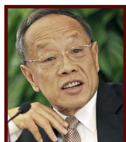
李肇星 中国前外交部长