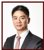
刘强东 京东集团董事长